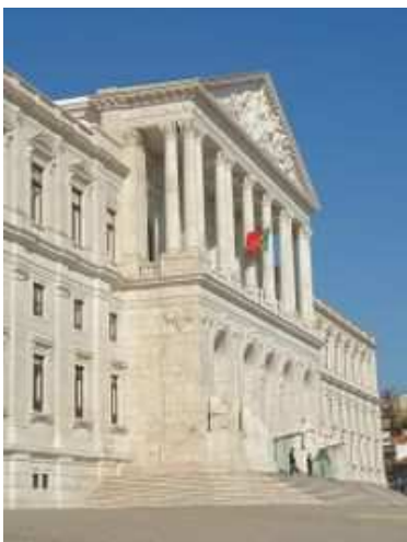
Asamblea de la República

Las Regiones Autónomas de Azores y Madeira forman parte de la República de Portugal, pero desde 1976 cuentan con un gobierno autónomo. Macao es una región bajo la tutela de China y es gobernada bajo un régimen especial.