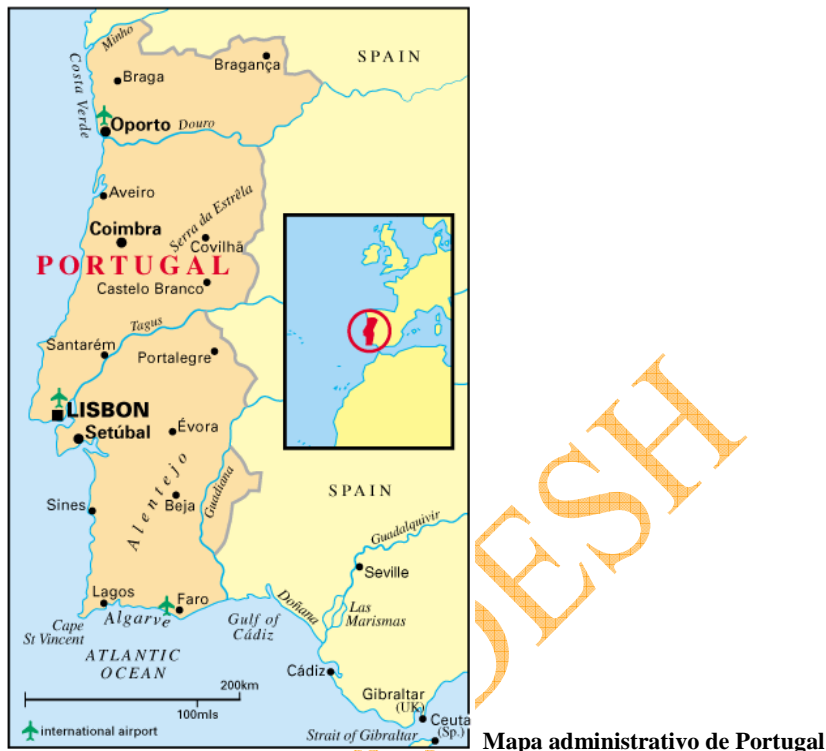
Mapa administrativo de Portugal

Portugal continental se divide en 18 distritos : Aveiro, Beja, Braga, Braganza, Castelo Branco, Coimbra, Évora, Faro, Guarda, Leiria, Lisboa, Portalegre, Oporto, Santarém, Setúbal, Viana do Castelo y Vila Real.