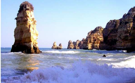
Playa de Algarve

El norte de Portugal es montañoso; el centro alrededor de Lisboa es plano y la costa del sur tiene enormes playas que llegan hasta la región del Algarve en la zona más meridional del país.