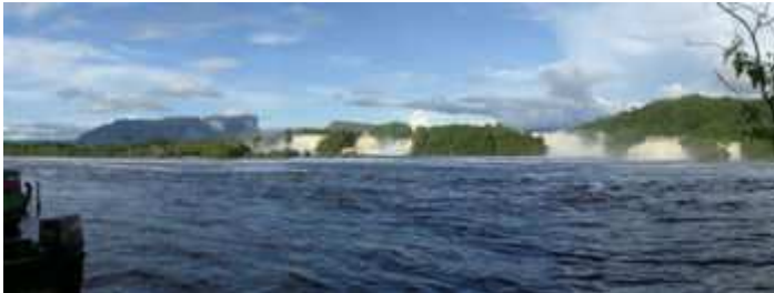
Canaima, Gran Sabana

Existen enormes reservas de Gas natural , asociadas y no asociadas con yacimientos de petróleo crudo. Se han encontrado nuevas reservas en la región nororiental, tanto en el continente como costa afuera, que hacen ascender las ya probadas a más de 3,9 billones de metros cúbicos de gas natural, lo cual ubica a Venezuela en el séptimo lugar a nivel mundial.