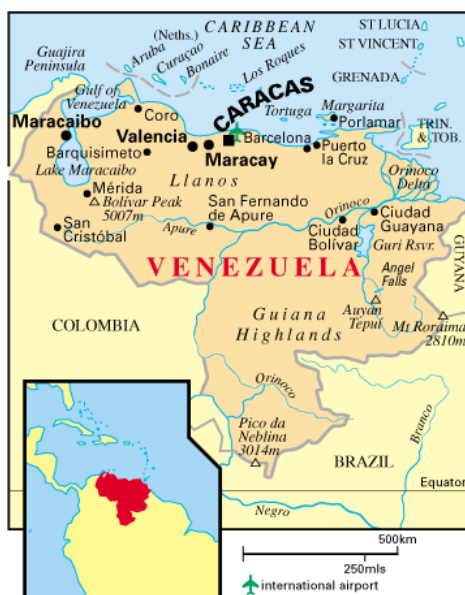
Mapa político de Venezuela

En Venezuela existe además un orden por regiones político-administrativas, el cual agrupa a los estados según sus características sociales, económicas y tradicionales; en Venezuela existen 10 regiones político-administrativas.