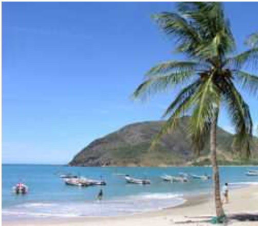
Playa de La Galera, en Margarita

Los años 80 fueron de crisis por el desmedido crecimiento del gasto interno debido a la política que desarrollaron los dos partidos tradicionales. El deterioro social se tradujo en 1989 en el " caracazo ", auténtica revuelta popular en protesta por un aumento de los impuestos, decretada en la segunda presidencia de Carlos Andrés Pérez (1989-1993).