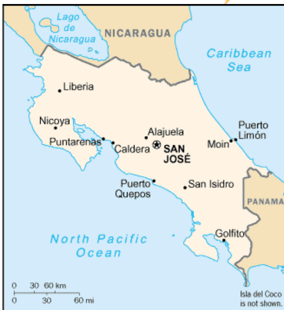
Provincias de Costa Rica