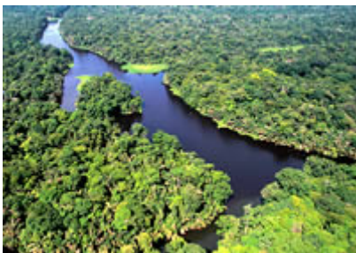
Parque Nacional de Tortuguero

Por último, otra de sus mayores fuentes de ingreso es el turismo , que ha iniciado un ascenso vertiginoso desde el año 1996.