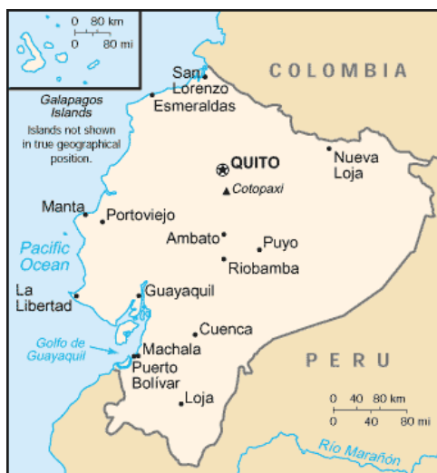
Mapa político de Ecuador