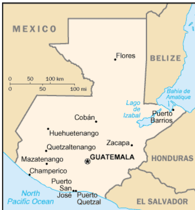
Poblaciones más importantes de Guatemala