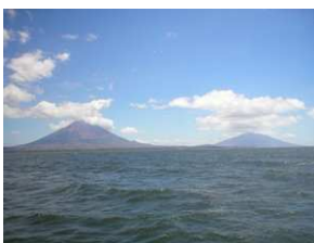
Isla de Ometepe y Lago Nicaragua

Sin embargo, gran parte los esfuerzos del Gobierno están centrandos ahora mismo en la industria del turismo , área del país muy poco explotada que sin embargo goza de gran potencial. Se espera un rápido incremento de la inversión tanto externa como interna en este campo. Actualmente ya operan en la zona grandes grupos hoteleros procedentes de Europa y de Canadá.