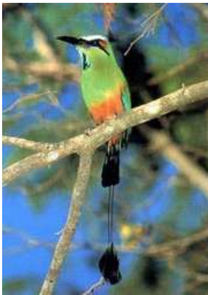
Guardabarranco: ave nacional

La posición geopolítica del país lo convertía en pieza estratégica clave en la expansión estadounidense hacia el Oeste. Por eso, en 1856 desembarcaron en Nicaragua 120 estadounidenses al mando de William Walker, quien con apoyo disimulado pero real de Washington logró proclamarse presidente de Nicaragua. Su propósito era extender el territorio destinado al sistema de esclavitud que estaba a punto de ser abolido en la Unión. Walker fue derrotado por los ejércitos aliados de toda América Central en 1857 y murió fusilado en 1860, cuando pretendía iniciar otra invasión en Trujillo, Honduras. En 1875 y 1895 los puertos de Nicaragua fueron ocupados militarmente por Alemania y Gran Bretaña respectivamente, que administraron sus aduanas para cobrarse deudas.