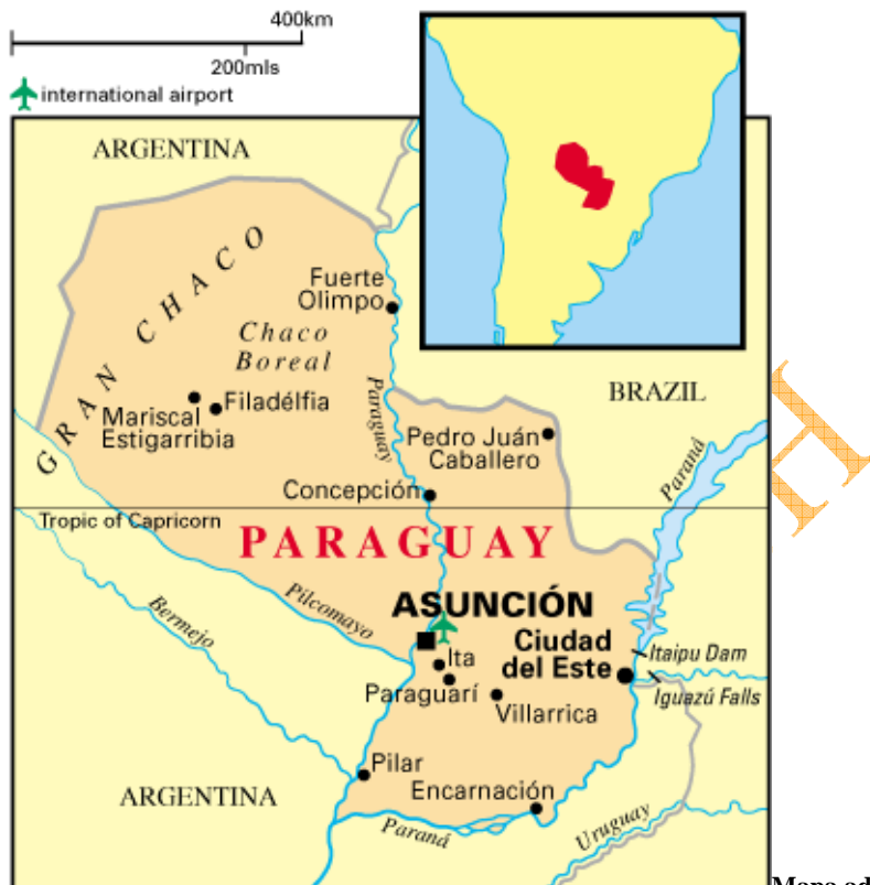
Mapa administrativo de Paraguay

Los principales partidos políticos son: ANR (Asociación Nacional Republicana-Partido Colorado- actualmente en el poder), PLRA (Partido Liberal Radical Auténtico), PRF (Partido Revolucionario Febrerista), UNACE (Unión Nacional de Ciudadanos Éticos), MPQ (Movimiento Patria Querida), PS (País Solidario), EN (Encuentro Nacional), PDC (Partido Demócrata Cristiano), ATP (Asunción para Todos) y PPT (Paraguay para Todos).