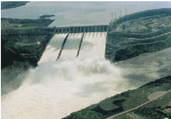
Presa de Itaipú

Los ríos de Paraguay, muy aptos para los proyectos hidroeléctricos , son también recursos destacados por sus caudales. Casi toda la electricidad de Paraguay se genera en instalaciones hidroeléctricas . El gran proyecto hidroeléctrico de Itaipú , inaugurado en 1983, se llevó a cabo conjuntamente con Brasil. Paraguay explota con Argentina la central hidroeléctrica de Yaciretá y negocia con este país la posibilidad de construir nuevas represas para aumentar la potencia del sistema eléctrico paraguayo.