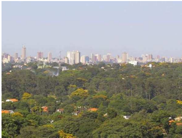
La capital: Asunción

El río de la Plata fue un territorio plural y administrativamente inconexo hasta la creación del virreinato en 1776. Contaba con tres gobernaciones: Río de la Plata (Buenos Aires), Guayrá (Paraguay) y Tucumán (Córdoba), a las que se vinculaba económicamente el Corregimiento de Cuyo . El virreinato fundado en 1776 estuvo integrando política y administrativamente por Buenos Aires, Paraguay, Tucumán, Potosí, Santa Cruz de la Sierra, Charcas y Cuyo, siendo Paraguay una Intendencia dentro del virreinato .