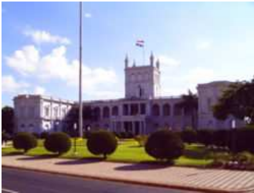
Palacio de Gobierno

El Poder Ejecutivo es ejercido por el Presidente de la República . Además existe un Vicepresidente quien, en caso de impedimento o ausencia temporal del Presidente o vacancia definitiva de dicho cargo, lo sustituye con todas sus atribuciones. El Presidente y el Vicepresidente son elegidos por votación popular en forma conjunta, para un mandato de cinco años, sin posibilidad de reelección.