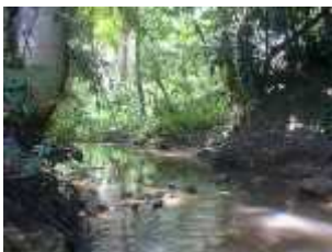
Paisaje zona Oriental

La parte Oriental posee las principales cordilleras , destacándose las de Caaguazú, Mbaracayú y Amambay. Son serranías bajas, de relieves suaves, constituidos por rocas graníticas y tierra roja en donde se desarrolla naturalmente una densa vegetación que ha sido gravemente deforestada a lo largo del siglo XX.