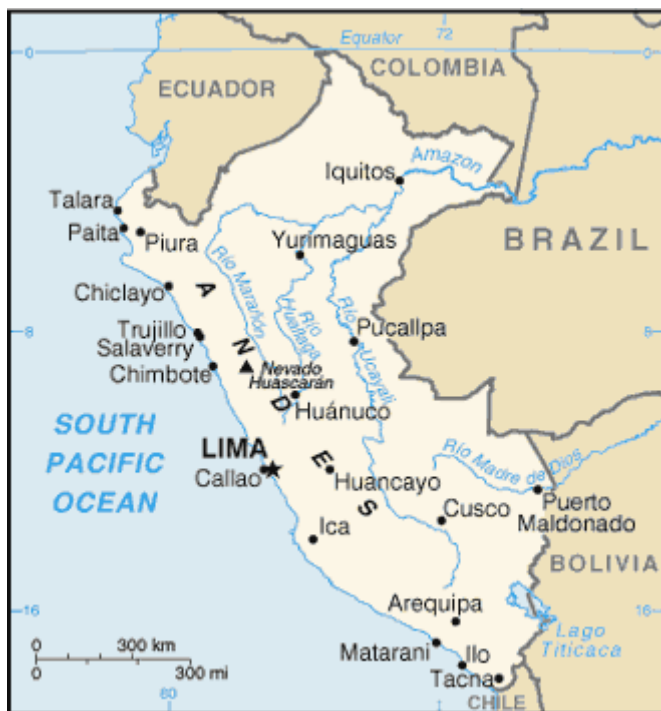
Mapa político del Perú

Perú se divide en 24 departamentos que son los siguientes: Amazonas, Ancash, Apurímac, Arequipa, Ayacucho, Cajamarca, Cuzco, Huancavelica, Huánuco, Ica, Junín, La Libertad, Lambayeque, Lima, Loreto, Madre de Dios, Moquegua, Pasco, Piura, Puno, San Martín, Tacna, Tumbes y Ucayali.