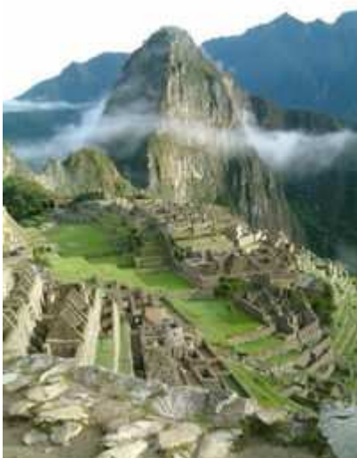
Machu Picchu, obra arquitectónica inca

En 2004, se dió inicio a la Comunidad Sudamericana de Naciones, de la cual el Perú fue anfitrión de su nacimiento.