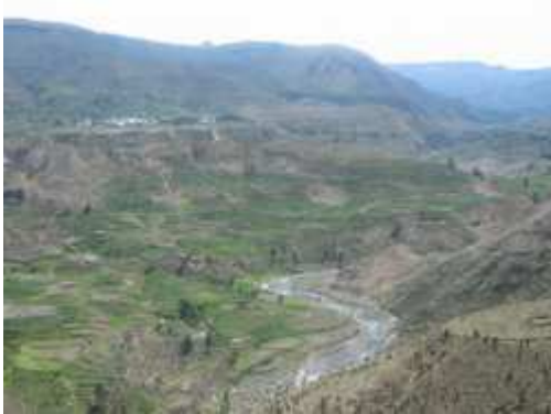
Valle del Colca

La principal unidad de relieve en el Perú es la Cordillera de los Andes , cuya pendiente se inicia a escasos metros de la costa, llegando a más de 6.700 metros de altitud siendo su punto más alto el del nevado Huascarán (6.768 m). Los Andes poseen múltiples yacimientos de metales (hierro, cobre, zinc, plata y oro entre otros) por su particular formación.